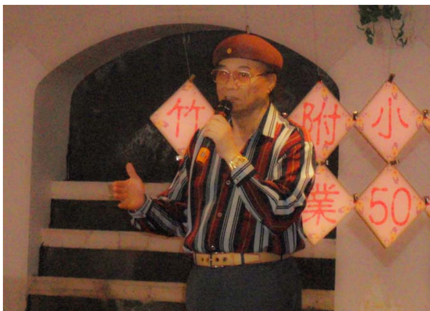
出席竹師附小 畢業 50 年重聚時 2010.5.1