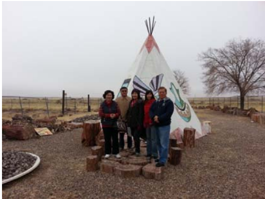
眾美女腳下踩的正是千萬年前的化石木頭後面是 Puerco Indian Teepees 普爾科印弟安原住民帳篷的複製品