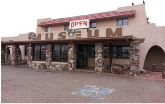
這是公園入口處一間兼賣紀念品的商店，門前廊柱貼的都是木化石和其他珍貴岩石的切片