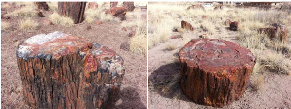
公園南方散佈著大量美麗無比的木化石，這些木化石原本於二億五千萬年(三疊紀)前生長在淺溪或沼澤的松柏植物，學名是 ARAUCARIOXYLON 。當倒下後堆積在淺灘，被富有礦物質的土壤或火山灰覆蓋，隔絕了氧氣而延緩腐壞，隨著歲月的增加，矽緩緩地滲入樹木的細胞，硬化之後成為彩色奪目的水晶体，有些化石木的細胞壁會完全融解被紫水晶、煙晶或碧玉所取代，就更為珍貴。