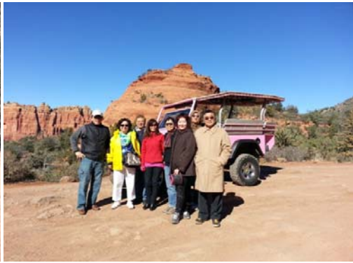
搭乘粉色吉普車遊覽群山奇峰，茵台巧遇帥男？您猜猜!!